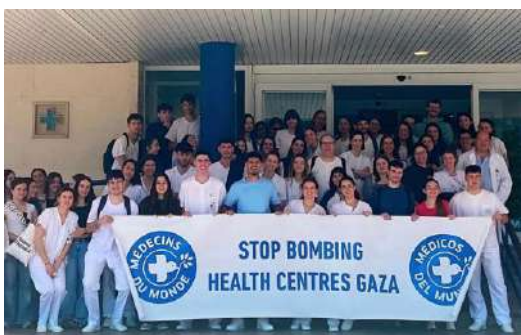
Charla en UNIZAR, campus Huesca