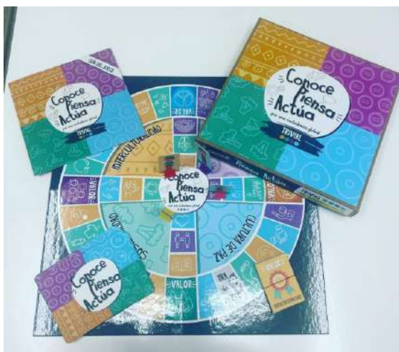
Juego “Conoce, piensa, actúa”