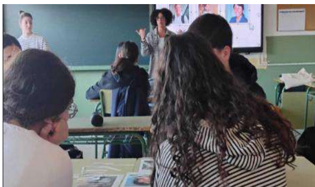
Talleres en el IES Ítaca