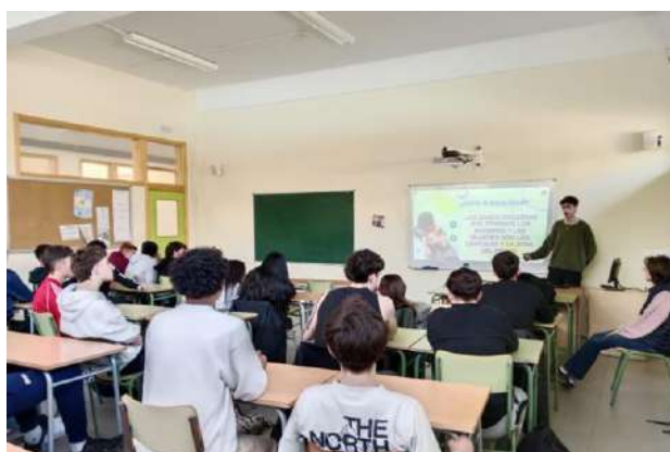
Talleres en el IES Miguel Servet