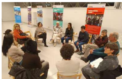
Charla en Haztecoop Huesca