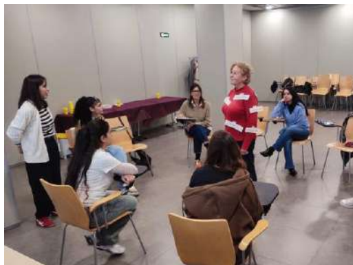
Sesión sobre migración e interculturalidad.