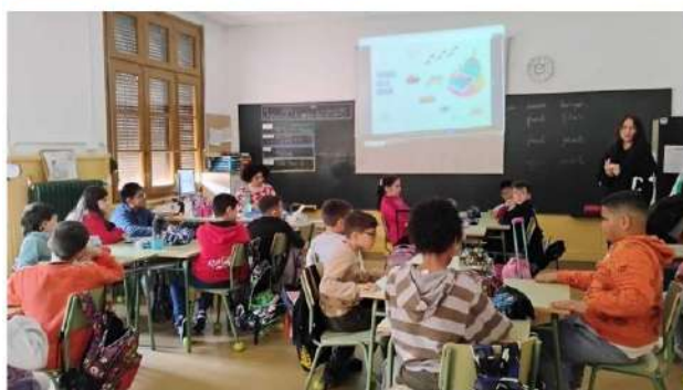
Talleres en CEIP Salvador Mengujón, Calatayud