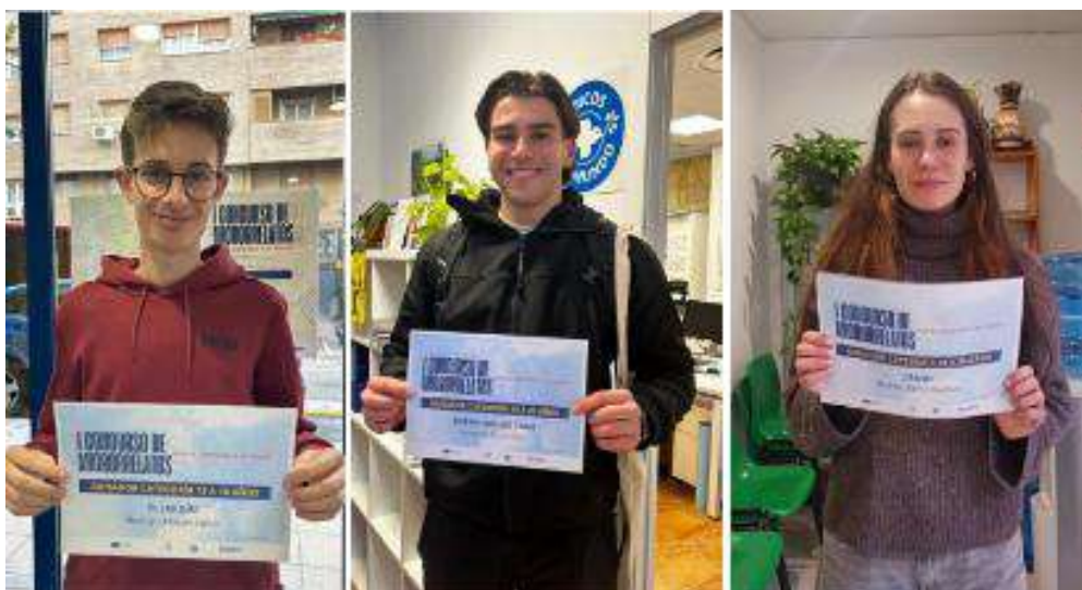
Ganadores del concurso de microrrelatos

Este proyecto continúa en ejecución hasta junio de 2026.