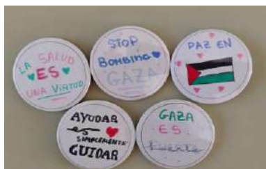
Talleres en el IES Biello de Aragón