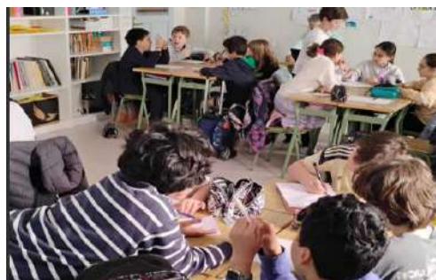
Talleres en el Colegio La Salle Franciscanas