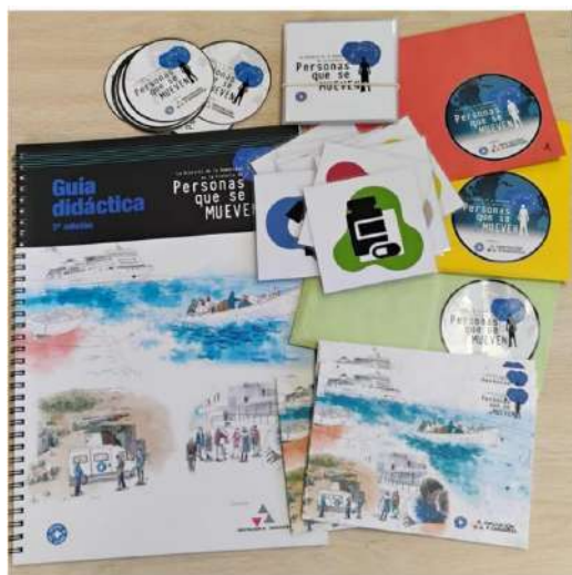
Materiales del proyecto