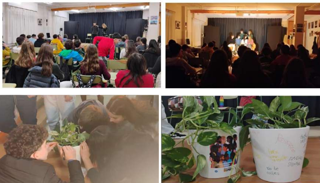
Taller de teatro foro y activismo en el IES Pirineos Jaca.