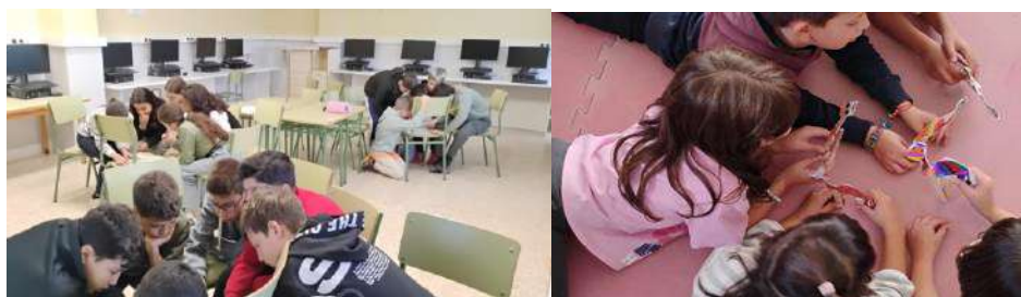
Talleres en el Colegio Público Luis Turón – Hajar (Teruel)

“Personas que se mueven, proyecto de educación para el desarrollo sobre derechos humanos, con especial atención al derecho a la salud y al derecho de asilo/refugio” FASE VIII