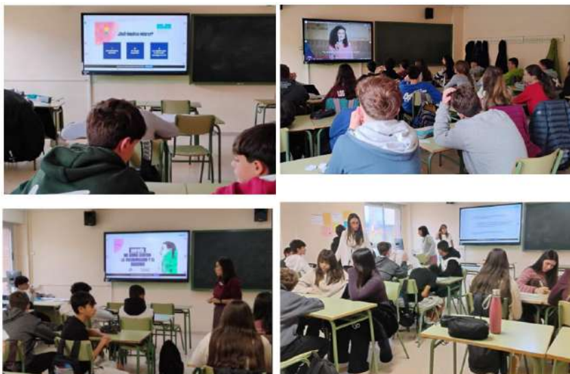
Talleres en el IES Pirineos Jaca